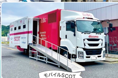
5Gを活用して遠隔治療支援をめざす 「モバイルスマート治療室」