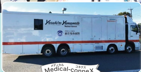
CT装置と生化学・免疫装置を同時搭載した医療車両 「Medical-conneX」